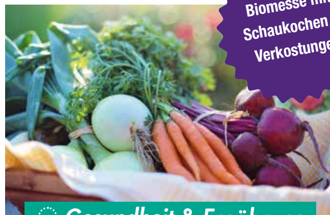
◉ Gesundheit & Ernährung

Gut gestylt in jedem Alter. Die neuesten Trends für 55+ werden auf der Messe kompakt präsentiert. Als Entscheidungshilfe, was alles gekauft werden soll, dienen mehrmals stattfindende Fashionshows. Sie verkaufen stylische Mode, Pflege- oder Schminkeprodukte? Dann sichern Sie sich schnellstmöglich Ihren Standplatz.